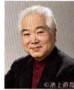
池田 菊衛 (Vn.2)

桐朋学園とジュリアード音楽院で学ぶ。1969年に東京カルテットを結成し、12年間第1ヴァイオリンを務めた。DGG、CBS、RCAなどに録音を残し、モントルー・ディスク大賞グランプリを受賞。グラミー賞にも数回にわたりノミネートされた。近年は指揮者としても活躍するほか、教育方面にも力を注ぎ、門下生には数多くの国際コンクール入賞者がいる。現在、桐朋学園大学特命教授、東京音楽大学特任教授。マンハッタン音楽院のファカルティとして後進の指導にあたる。