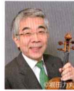
原田 幸一郎 (Vn.1)

桐朋学園とジュリアード音楽院で学ぶ。1969年に東京カルテットを結成し、12年間第1ヴァイオリンを務めた。DGG、CBS、RCAなどに録音を残し、モントルー・ディスク大賞グランプリを受賞。グラミー賞にも数回にわたりノミネートされた。近年は指揮者としても活躍するほか、教育方面にも力を注ぎ、門下生には数多くの国際コンクール入賞者がいる。現在、桐朋学園大学特命教授、東京音楽大学特任教授。マンハッタン音楽院のファカルティとして後進の指導にあたる。